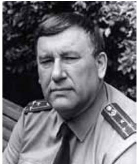
Из сирийской тетради